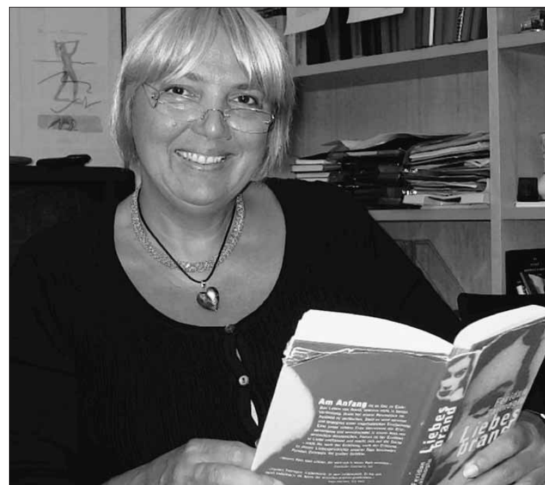
Deutsche Romantik und orientalische Erzählkunst verschmelzen in Claudia Roths Lieblingsbuch „Liebesbrand“.

„Ich kannte Feuerzungen, aber keinen Liebesbrand im Herzen, ich war im Westen verdorben, ich war ein durch und durch degenerierter Mann des Abendlandes, und von der Tradition der orientalischen Frauenanbetung hatte ich keine Ahnung“, sagt der Erzähler David in „Liebesbrand“. Claudia Roth ist öfter in der Türkei. Wird die Frau dort mehr angebetet? Nun, eigentlich sei es ja das, was man sich als Frau von den Männern